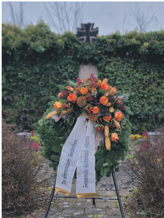
Soldatenfriedhof in Gutenzell

Herzlichen Dank an alle teilnehmenden Bürgerinnen und Bürger. Ebenfalls ein herzliches Vergelt's Gott an den Musikverein Gutenzell sowie den Männergesangsverein Gutenzell-Hürbel für die musikalische Begleitung.