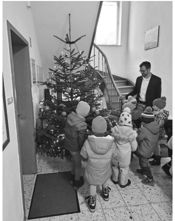
Christbaum im Rathaus Gutenzell

Allen Bürgerinnen und Bürger eine besinnliche Adventszeit!