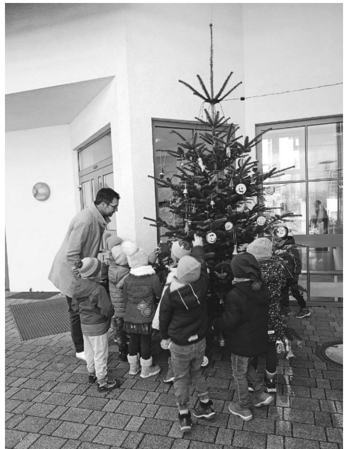
Christbaum am Gemeindehaus Hürbel